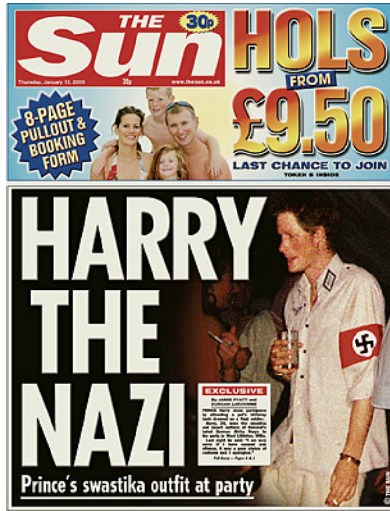
Titelseite „The Sun“ vom 13. Januar 2005

Darf man sich als Nazi verkleiden? Findet drei Argumente dafür und drei dagegen.