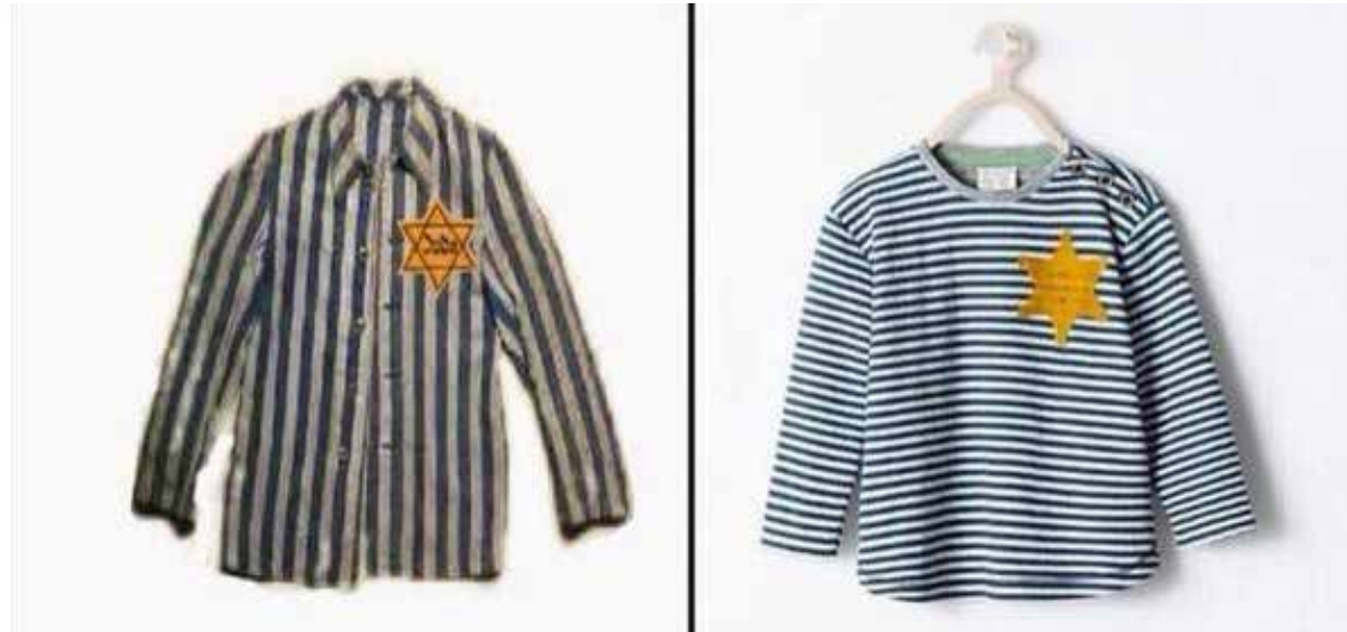
Screenshot twitter.com (Ausschnitt)

Was denkt ihr: Sollte man so ein T-Shirt verkaufen? Findet drei Argumente dafür und drei Argumente dagegen.